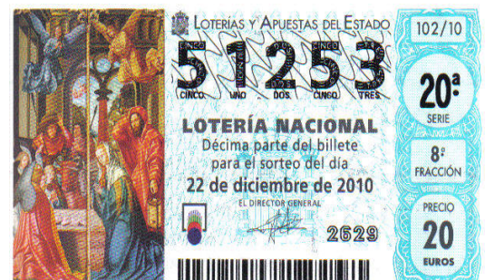
«NAVIDAD» Adornación de los pastores: Retablo de San Juan Bautista. Escuela florentina, siglo XV. Panteón del Sr. Salvador, Valladolid.